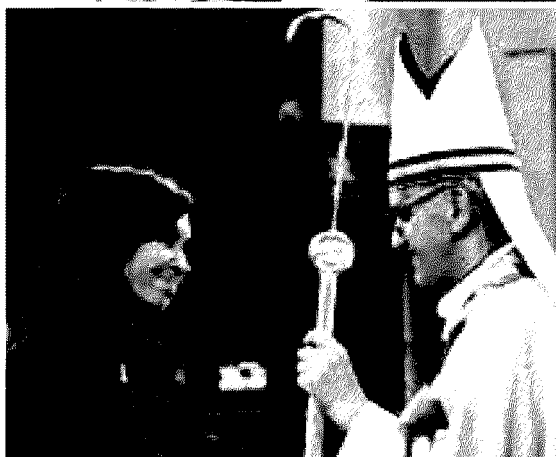
Il presidente argentino Cristina Kirchner e Bergoglio