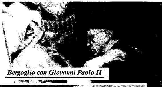
Bergoglio con Giovanni Paolo II