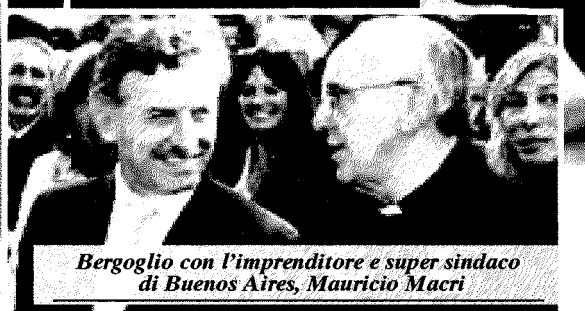
Bergoglio con l'imprenditore e super sindaco di Buenos Aires, Mauricio Macri

Ritaglio stampa ad uso esclusivo del destinatario, non riproducibile.