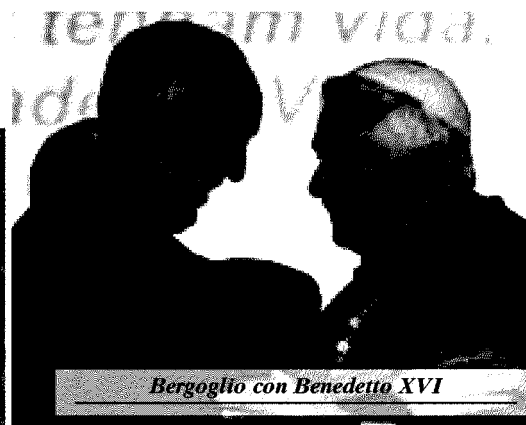
Bergoglio con Benedetto XVI