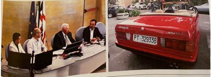
Circolo Sardo Automoto d'Epoca