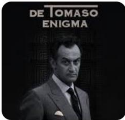
De Tomaso | Film Documentario